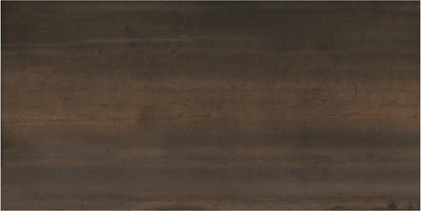
Керамогранит Baldocer Iron Black Lapado Rectificado 60x120